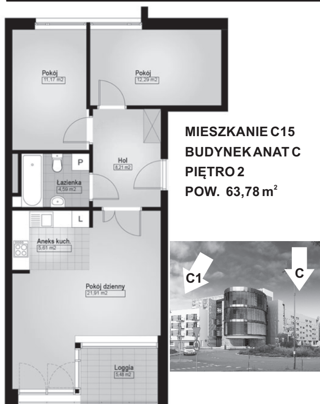
MIESZKANIE C15 BUDYNEK ANAT C PIĘTRO 2 POW. 63,78 m 2