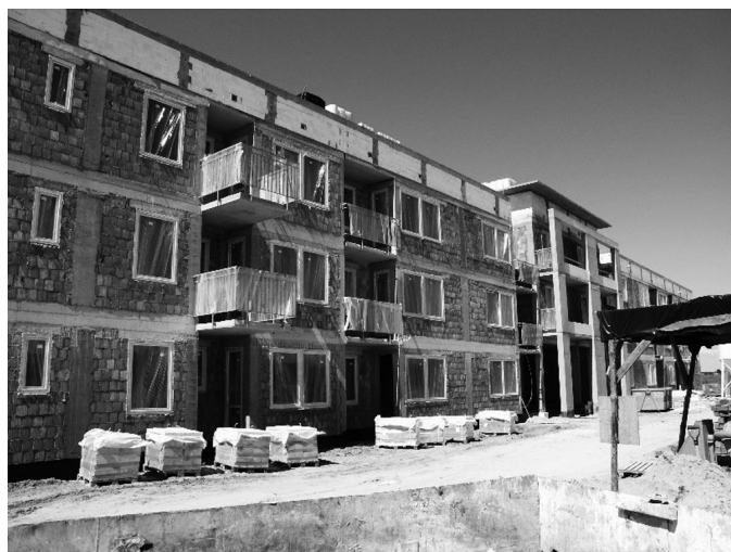
Budynek 10A na os. Przylesie

Zakończenie obu inwestycji planowane jest na I kwartał 2011 roku. Zainteresowani bliższe informacje mogą uzyskać pod nr telefonu 22 784 27 07 lub osobiście w pokoju nr 7 w biurcu SMLW przy ul. Jagiellońskiej 11.